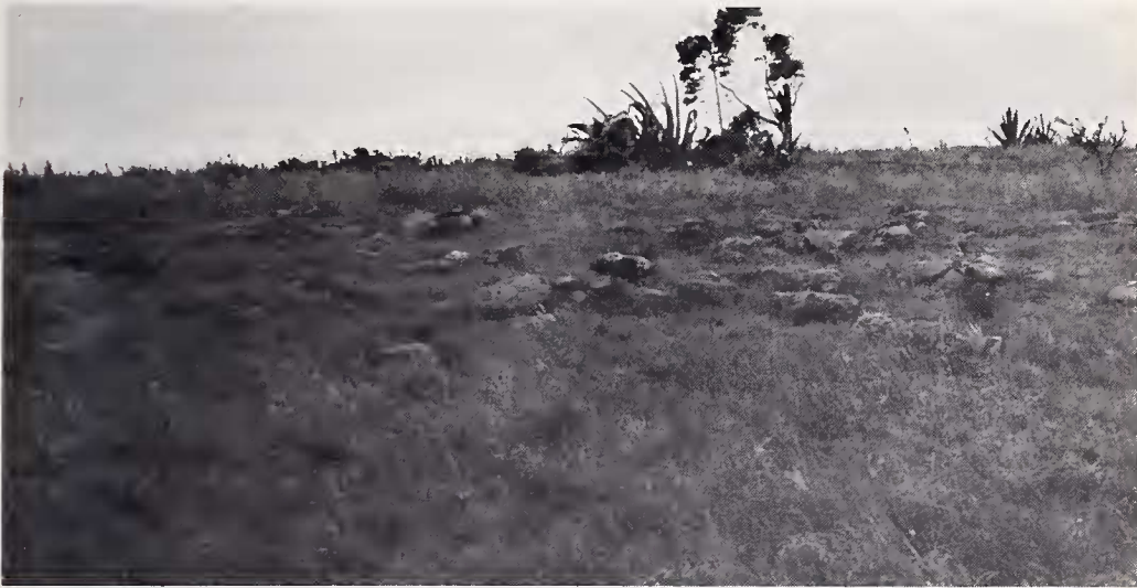
Abb. 3: Der Fundort von Scelotes brevipes bei Ubombo, Natal.

In Ubombo findet man dieselben Bodenbedingungen für diese Substratwähler wieder — lockeren Humus, eine dichte Grasbedeckung mit viel Wurzelwerk und Steinen (Abb. 3), nur mit dem Unterschied, daß es hier viel feuchter und nicht sandig ist. Ebenso werden Stellen unter Steinen bevorzugt, wahrscheinlich, weil die Erde bei der regnerischen und bewölkten Witterung dort trockener war. Außer niedrigem Gestrüpp waren Agaven, Eucalypten und Palmen vorhanden. Rundum wird intensiv beweidet und hier und da gepflügt. Die Berghänge sind meist grasbewachsen, nur selten finden sich noch Reste der üppigen Primärvegetation.